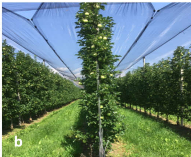
Abbildung 366: a: 'Golden Delicious' nach dem Peter-Matha-Schnitt b: dieselbe Reihe im Sommer

System entstand: Der Peter Matha-Schnitt . Und weil diese Methode besonders gut für intensive Pflanzsysteme geeignet ist, verwendet er sie heute in Perfektion bei Bi-Bäumen®.