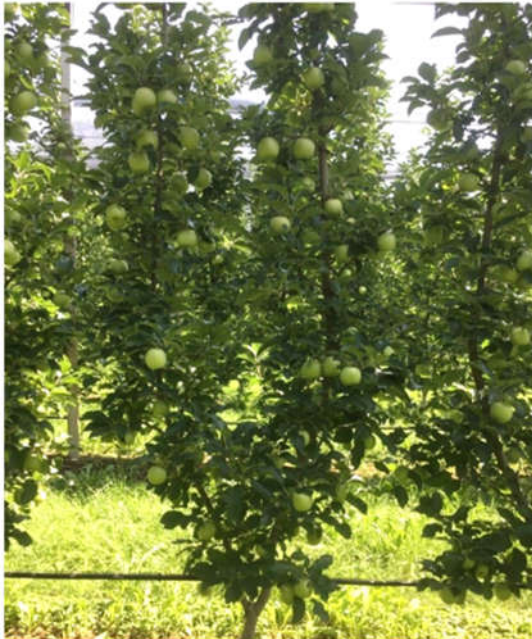
Abbildung 367: Draufsicht derselben Reihe im Sommer

Und weil das Wachstum gering ist, ist kein Wurzelschnitt erforderlich. Meist auch kein Einsatz von Prohexadione-Calcium – höchstens bei sehr schlechtem Blühwetter.