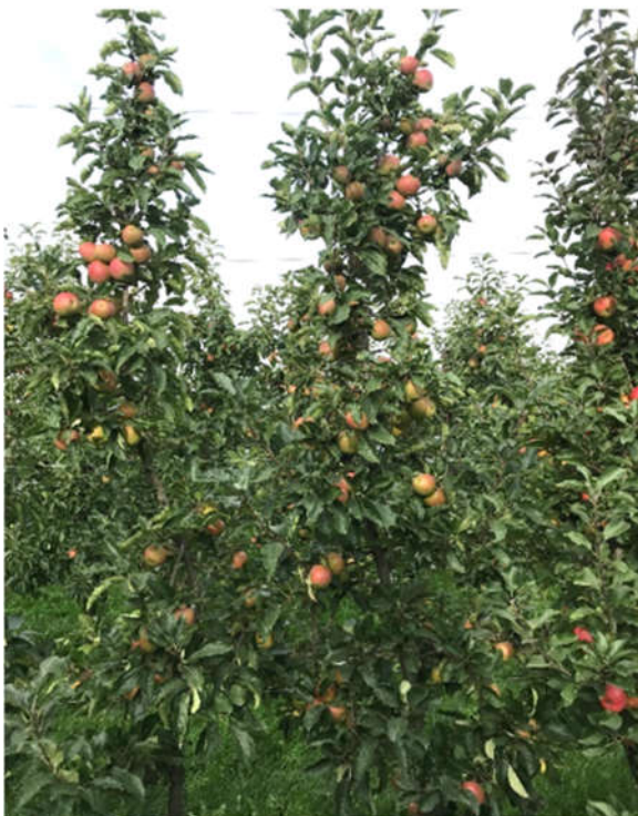
Abbildung 373 : 'SQ159'/Magic Star®/Natyra®, 5 Jahre alt

Ausnahmen bilden lediglich triploiden Sorten wie 'Boskoop' und die 'Jonagold'-Gruppe, an denen ansonsten zu große Früchte entstehen würden.