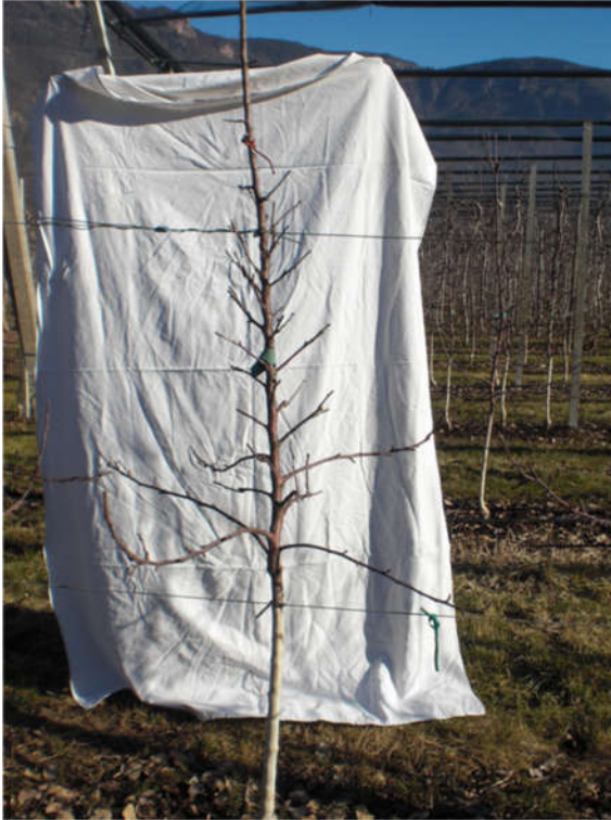
Abbildung 369 Peter Matha-System im 2. Jahr

Dabei sind die Abstände immer abhängig von Sorte, Standort und der leichteren/schwierigeren Ausfärbung der Sorte.