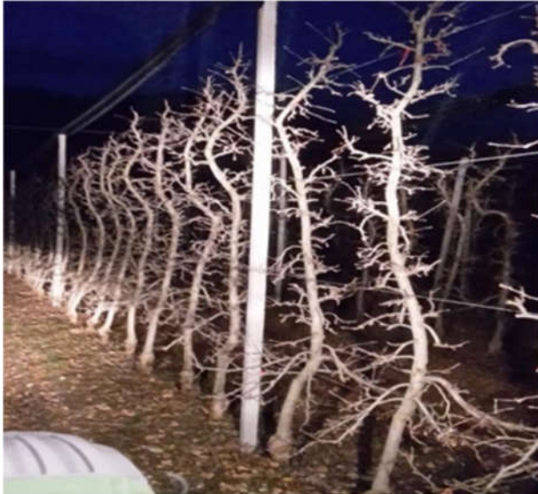
Abbildung 371: Perfekt gemäß Peter Matha-Schnitt erzeugene Bäume geformte Bäume

h. Der Grund, warum wir beim Peter Matha-Schnitt die sehr starken Seitenäste wieder auf kurze, 2-3 cm lange Zapfen bzw. auf Sattel zurückschneiden ist, die Seitenaststruktur aufzulockern und einen starken neuen Neutrieb zu generieren, aus dem dann mit der gleichen Schnitttechnik (b-f) allmählich wieder neue Aststruktur aufgebaut wird.