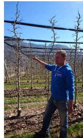
Abbildung 365 Unmittelbar daneben: Gleich-altrige Bäume nach Peter Matha-Schnitt

Er begann dann, seine Bäume stufenweise stärker zurückzuschneiden, woraufhin er einen Rückgang des vegetativen Wachstums beobachtete. Bei den Neuanlagen setzte er die neuen Erkenntnisse von Anfang ein, bis daraus allmählich sein