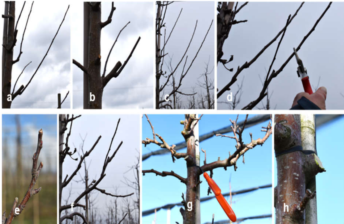
Abbildung 370 Peter Matha-Schnitt Schritt für Schritt. Nicht auf zu starke Triebe ableiten!

Im folgenden Abschnitt wird die Vorgehensweise beim Peter Matha-Schnitt an einem Seitenast Schritt für Schritt erklärt, anhand der Bilder aus der nachfolgenden Abbildung: