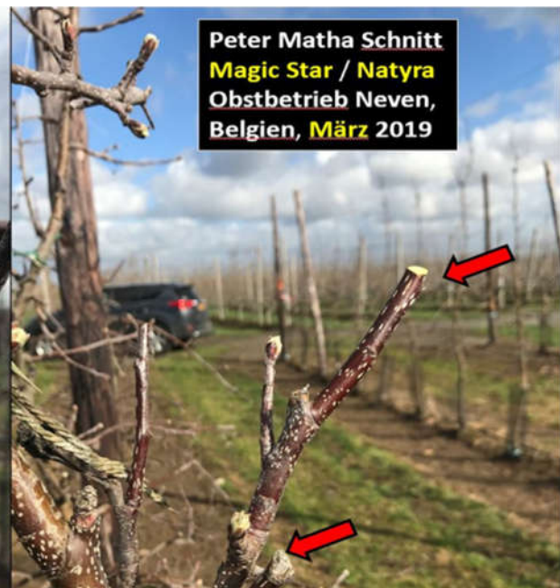
Abbildung 372: Diese Bäume wurden vom langen Fruchtholzschritt auf Peter Matha-Schnitt umgestellt. Die roten Pfeile maskieren die typischen 5-7 cm langen Zapfen